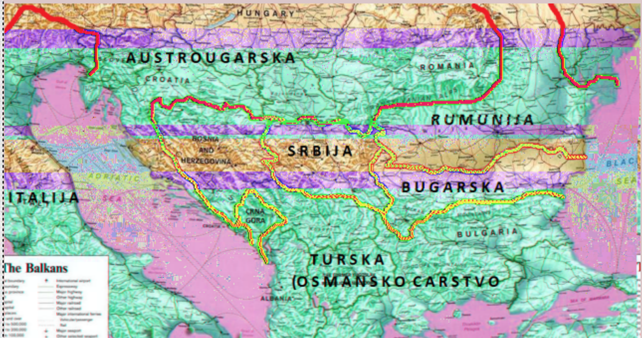
http://angusyong111.wordpress.com/2012/07/19/bosnjaci-u-crnoj-gori/ (downloaded on 6. travnja 2013.)